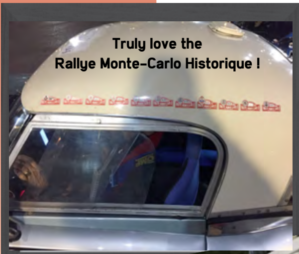
Truly love the Rallye Monte-Carlo Historique !