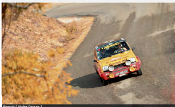
Renault 5 Alpine Gruppo 2

Tweet 2 aime 10 personnes aiment ça. Inscription pour voir de que vos amis aiment.