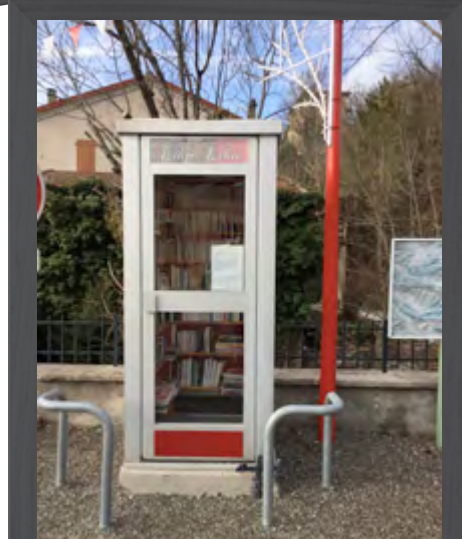
La bibliothèque Municipale !