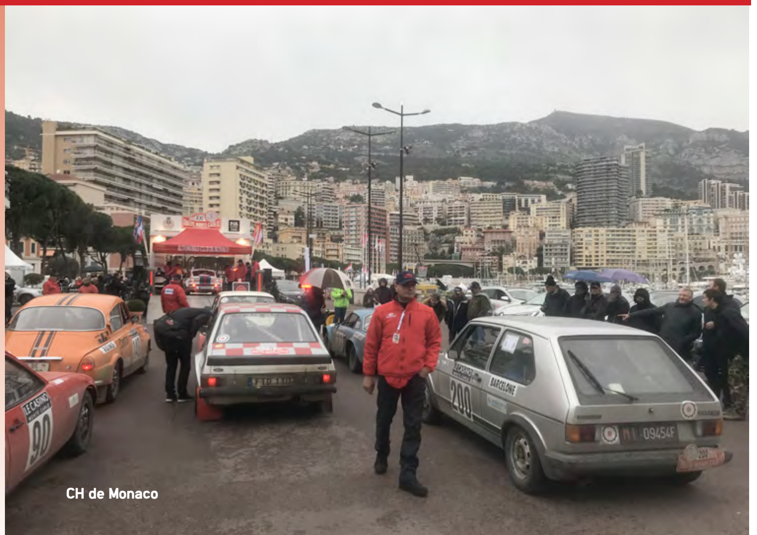
CH de Monaco